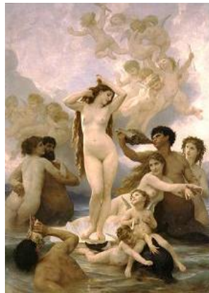
(La naissance de Vénus, de W. Bouguereau.)

Je suis maintenant à la grande école, et je suis tombée amoureuse de Vénus.